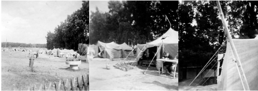
Zelte im Pionierlager „Lilo Herrmann“ Bad Saarow