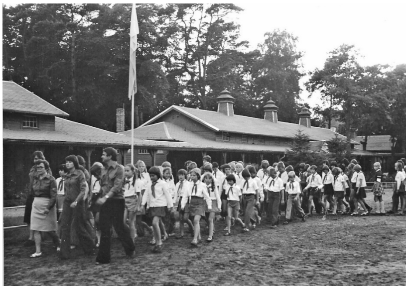
Einmarsch der Pioniere aus Berlin ins Pionierlager Ahlbeck