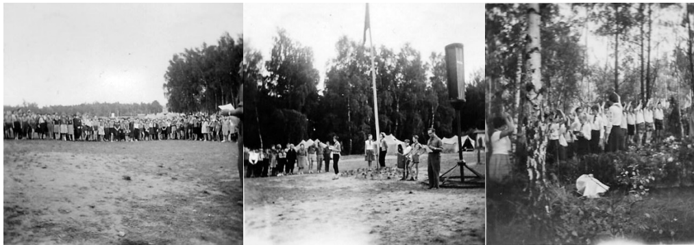
Appell und Thälmann-Ehrung im Pionierlager „Lilo Herrmann“

An einem Sonntag lagerten wir alle rund um den Lautsprecher auf dem Appellplatz, Heinz-Florian Oertel berichtete im Radio von der Radweltmeisterschaft auf dem Sachsenring. Täve Schur, Weltmeister 1958 und 1959, verhalf Bernhard Eckstein zum Sieg. Das machte ihn für uns zur Legende. Der Jubel war grenzenlos. Ich selbst legte im Lager das Sportabzeichen der DDR ab und schaffte die Prüfung für die neue Schwimmstufe III. Erstmals interessierte ich mich in diesem Lager für ein Mädchen. Zu dieser Zeit war ich Freundschaftsratsvorsitzender in meiner Schule und besuchte mit einer Pionierdelegation Budapest. Auch dort waren wir Gast in einem Pionierlager auf den Budaer Bergen.