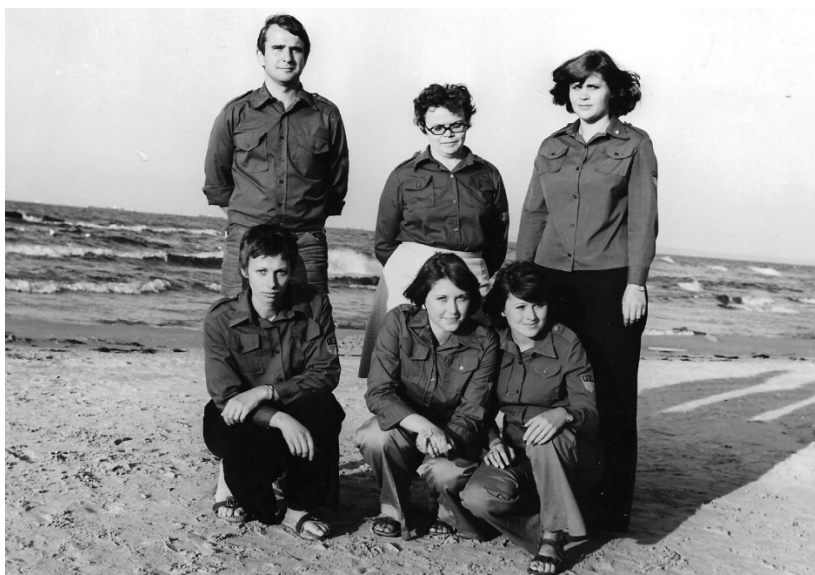
Pionierleiterstudentinnen aus Droyßig als Betreuer der Kinder der Mitarbeiter des Zentralrats der FDJ

Und schließlich gab es in den 1980er Jahren grundlegende Änderungen in der materiellen Ausstattung der Zentralen Pionierlager. Bis dato waren es eigentlich nur Zeltlager. Die Sommer dieser Jahre waren aber den Zelten nicht wohlwollend. Es kam die Idee auf, in diesen Lagern doch mehr feste Gebäude zu errichten, um diese ganzjährig nutzen zu können. In Karl-Marx-Stadt habe ich deshalb mich dafür eingesetzt, dass das Zentrale Pionierlager in Einsiedel wunderschöne feste Gebäude erhielt und ähnlich wie die Pionierrepublik „Wilhelm Pieck“ am Werbellinsee das ganze Jahr über Kindern zur Erholung und auch Ausbildung zur Verfügung stand. Das Pionierlager „Lilo Herrmann“ in Bad Saarow u.a. erhielten ebenfalls Flachbauten (Bungalows) statt Zelte. Das war ein gemeinsames Projekt des Amtes für Jugendfragen beim Ministerrat der DDR und des Zentralrats der FDJ. Ich kannte viele Lager: Einsiedel und Schneeberg, Bad Saarow und Störitzsee, Ahlbeck auf Usedom und Wilhelmsthal bei Eisenach.